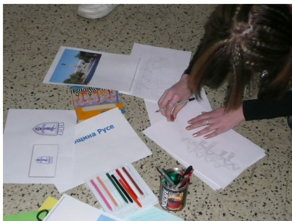
Рисунката е в процес на правене