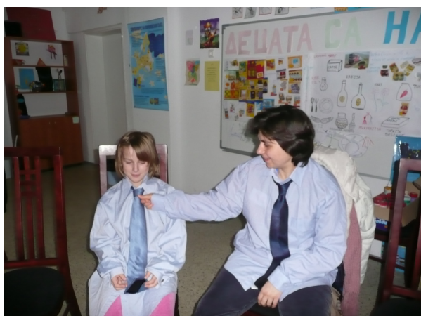
Делегати от ЕС

Отбор 2 – Нарисувайте символ за избирането на вашия град за европейски град на културата 2008.